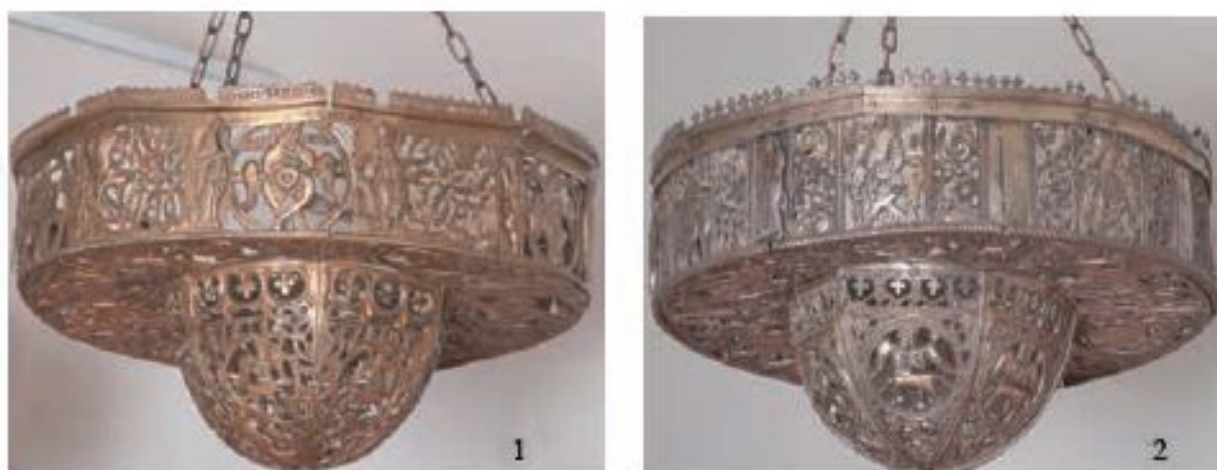
Рис. 4. Хоросы «Деисус» (музей-заповедник, Кремль, Великий Новгород): 1 – правый Китоврас (КП 7641); 2 – левый Китоврас (КП-7640)