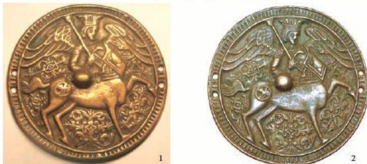
Рис. 1. Медальоны с Китоврасом: 1 – инв. № 6547/4 (Таймырский окружной музей, Дудинка); 2 – без инв. № (Музей этнографии Таймыра О.Р. Крашевского, турбаза «Бунисьяк», оз. Лама)

РФА количественно определил содержания всего лишь четырех элементов: меди, олова, свинца и железа, не дав результата анализа содержания цинка – важной примеси, определяющей тип сплава – латунь. Условно медный сплав медальона №3840-МАО можно определить как сурьмяно-свинцово-оловянистую бронзу Cu (76–78)% + Sn (20–22)% + Sb (0,1–0,4)% + Pb (0,6–1,0)%.