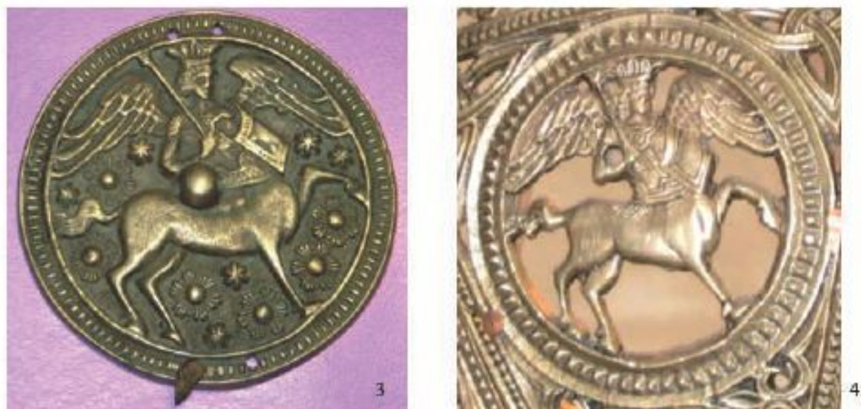
Рис. 2. Медальоны с Китоврасом: 3 – «Звездный» (инв. №3840, вес = 268,37 г, диаметр наружный 110,6 мм. Остров Фаддея в море Лаптевых. Музей Арктики и Антарктики, СПб.); 4 – прорезной (без №. Фрагмент хороса, МБГУ Псковский государственный объединенный историко-архитектурный и художественный музей-заповедник)

Этот медальон первого типа (по нашей классификации) оказался единственным по изображению Китовраса на фоне звезд и без клейма на конском крупе, за что он получил имя «Звездный Китоврас». Нам не удалось найти его копий-артефактов в различных российских и зарубежных музеях. Множество