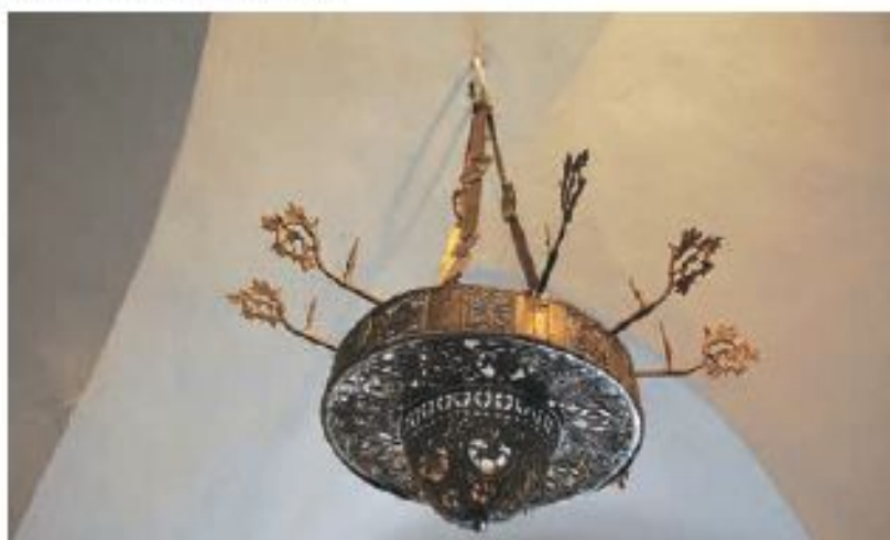
Рис. 3. Хорос-паникадило из православного храма Пскова XVI в. (МБГУ Псковский государственный объединенный историко-архитектурный и художественный музей-заповедник)

Рассматривая вопрос происхождения медальонов с изображением Китовраса, А.П. Окладников называет его кентавром и обращается к хоросам-паникадилам, но решения не находит. Что же первично? Китоврас на медальоне или Китоврас на хоросах? А может быть, и медальоны, и хоросы изготавливались в одной мастерской по одному проекту и в одно время? Он отмечает: «Для нашей темы важно, что изображенные на паникадилах-хоросах XV–XVI вв. кентавры совершенно аналогичны не только в общих чертах, но и в мелких деталях, кентавру с о. Фаддея. Они имеют распростерты в стороны и опущенные вниз концами крылья. На головах их видны короны с зубцами. В правых руках у них жезлы, покоящиеся на плечах и завершенные шишкой-сферой на верхнем конце» [Окладников, 1950, с. 155–156]. Здесь следует отметить, что визуально «совершенно аналогичны» Китоврасу с о. Фаддея по качеству исполнения, композиции, размерам, деталям изображения только Китоврасы на хоросе-паникадиле «Деисус» из храма Пскова XVI в. (рис. 2.-4, 3). Мы решили проверить эту «аналогичность» по химическому составу металла изделий.